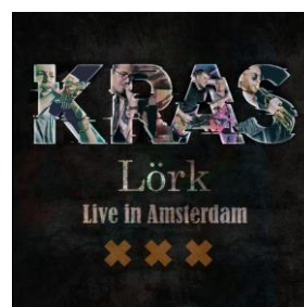
Kras – Live in Amsterdam 2020