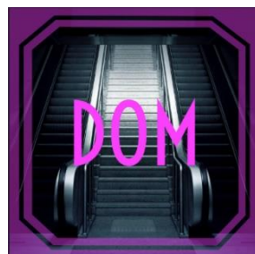
Dom (single) 2019