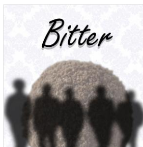
Bitter (EP) 2019